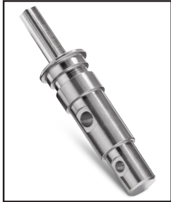
Adaptateur pour Tarière NDA-3 (vendu séparément)