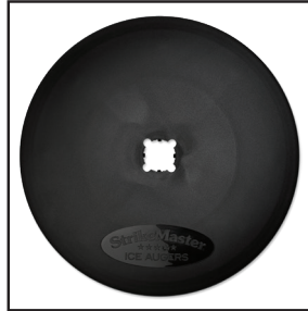
Disque protecteur (vendu séparément)