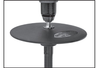
Assembler sur une perceuse sans fil et mèches de tarière