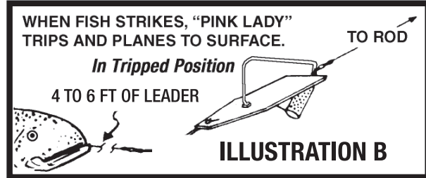
TRIPS AS SHOWN

The Pink Lady will dive approximately one foot for every two feet of line out. You can judge trolling depth by counting the number of line pulls off your reel. One pull of line (average distance from reel to first rod guide) equals about two feet of line and will yield one foot of dive. Example, 12 pulls equals 12 feet of dive. The exact diving depth can vary depending on line diameter, trolling speed, diver size, lure size, and if you use an attractor. However, counting line pulls is accurate enough and will allow you to quickly return to the fish-producing depth.